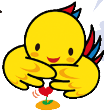
兵庫県マスコット はばタン