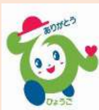
譲りあい 感謝マーク

ヘルプマーク・譲りあい感謝マークは、内部障害や難病の方など、援助や配慮を必要としていることが外見からは分からない方のために作成されたマークです。これらのマークを見かけたら、電車内で席をゆずる困っているようであれば声をかけるなどの思いやりのある行動をお願いします。