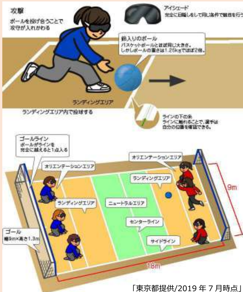
「東京都提供/2019年7月時点」

ゴールボールは、さんにん 三人ずつのプ レーヤーがアイシェード(目隠し) をちやくよう 着用して、バスケットボ ールの2倍の重さの鈴入りボールをころ 転がすように投げ合い、あいて 相手ゴール にボールを入れるだんたいきょうぎ 団体競技です。 ぜんしんけい しゅうちゅう ぜんしん 全神経を集中させて全身でゴ ールをまも 守るというシンプルな きょうぎせい みりよく にほん 競技性が魅力で、日本はロンドン パラリンピックできん 金メダルをかくとく 獲得 しました。