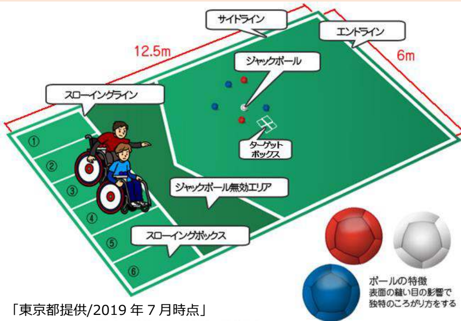
「東京都提供/2019年7月時点」

しろ もくひょうきゅう 白い目標球(ジャックボ ル)に、あか あお 赤・青のボールをいか にちか ぎそ に近づけるかを競います。投 げたり、ころ 転がしたり、ときに もくひょうきゅう はじ だいぎやくてん は目標球を弾いて大逆転 にほん も。日本はリオパラリンピッ くだんたいせんぎん かくとく クで団体戦銀メダルを獲得。 しょうがい うむ 障害の有無にかかわらず はばひろ ねんだい がた たの 幅広い年代の方が楽しめる きょうぎ 競技です。イベントなどで たいけん 体験してみよう！