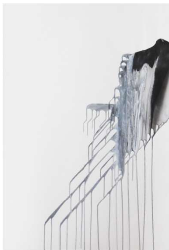
作品名 無題 作者名 澤田隆司 (さわだたかし) サイズ 1091×788mm