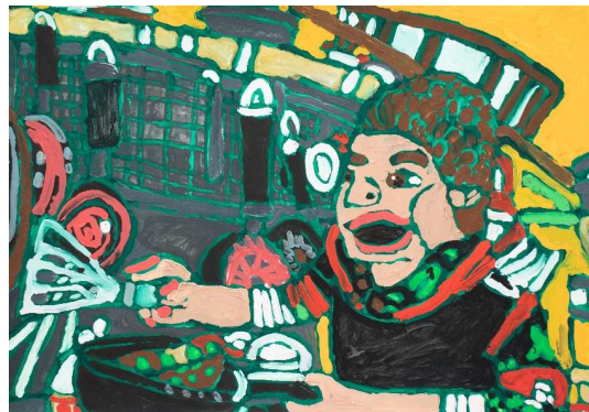
作品名 韓国料理店福ちゃん 作者名 小田浩之 (おだひろゆき) サイズ 545×788mm