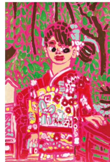
作品名 メリハリ 作者名 小田浩之 (おだひろゆき) サイズ 788×545mm