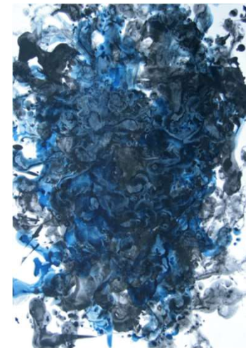
作品名 さだ23.5 作者名 佐田かおり (さだかおり) サイズ 1091×788mm