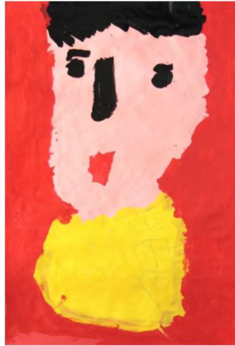
作品名 佐田かおり 作者名 佐田かおり (さだかおり) サイズ 1091×788mm