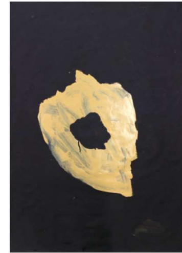
作品名 佐田かおり 作者名 佐田かおり (さだかおり) サイズ 1091×788mm