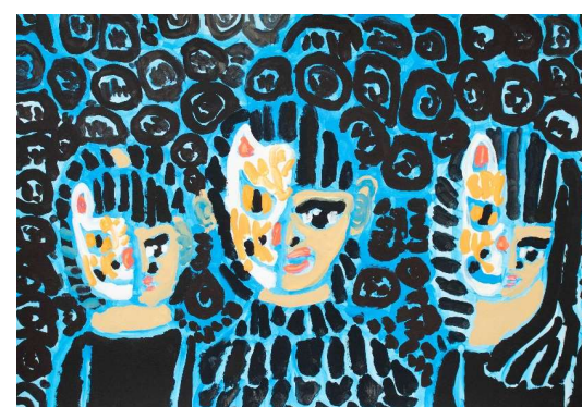
作品名 BABYMETAL 作者名 小田浩之 (おだひろゆき) サイズ 545×788mm