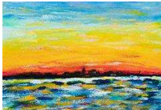
作品名 朝焼けの神戸 作者名 齋藤晴久 (さいとうはるひさ) サイズ 545×788mm