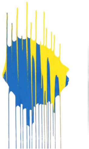
作品名 無題 作者名 澤田隆司 (さわだたかし) サイズ 1030×730mm