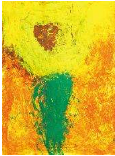
作品名 ひまわり 作者名 佐田かおり (さだかおり) サイズ 1091×788mm