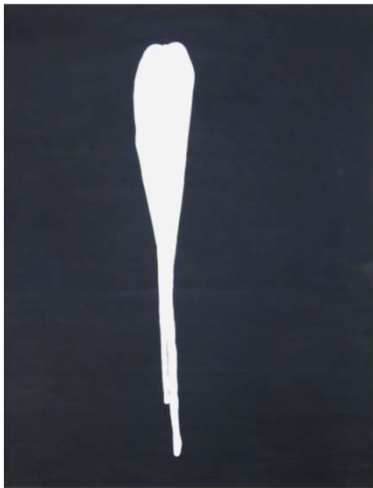
作品名 無題 作者名 澤田隆司 (さわだたかし) サイズ 788×545mm