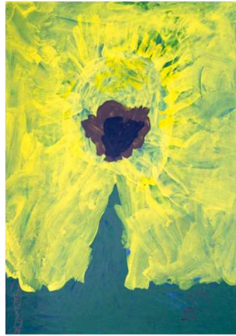
作品名 ひまわり 作者名 佐田かおり (さだかおり) サイズ 1091×788mm