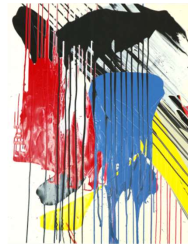
作品名 無題 作者名 澤田隆司 (さわだたかし) サイズ 1030×730mm