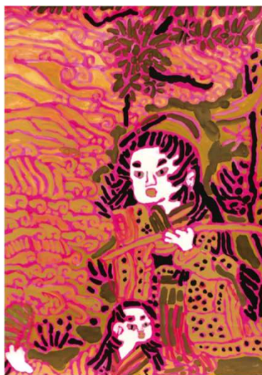
作品名 松風村雨図 (まつかぜむらさめず) 作者名 小田浩之 (おだひろゆき) サイズ 788×545mm