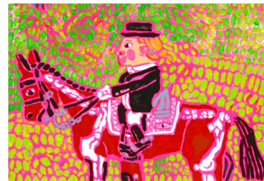
作品名 ホーシーズ インサイド アウト 作者名 小田浩之 (おだひろゆき) サイズ 545×788mm