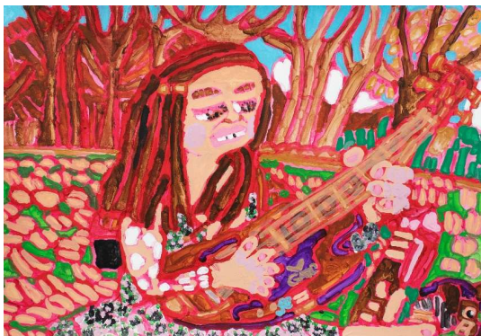
作品名 韓国料理店福ちゃん 作者名 小田浩之 (おだひろゆき) サイズ 545×788mm