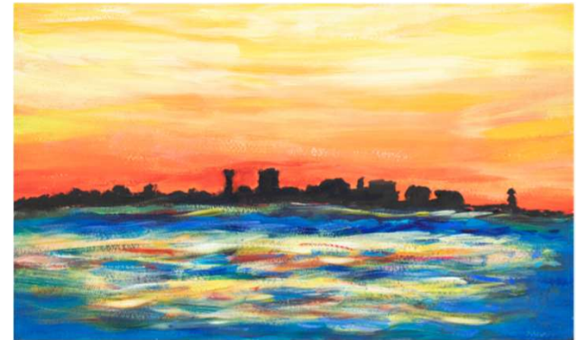
作品名 無題 作者名 齋藤晴久 (さいとうはるひさ) サイズ 210×295mm