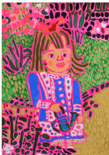
作品名 みずやり 作者名 小田浩之 (おだひろゆき) サイズ 788×545mm