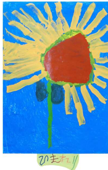
作品名 ひまわり 作者名 佐田かおり (さだかおり) サイズ 1091×788mm