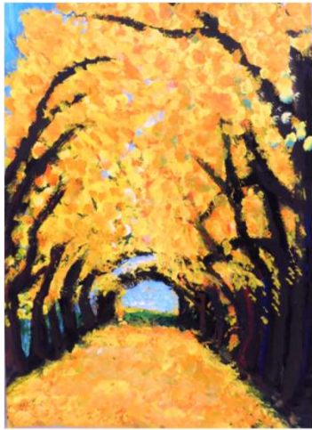
作品名 無題 作者名 齋藤晴久 (さいとうはるひさ) サイズ 545×790mm