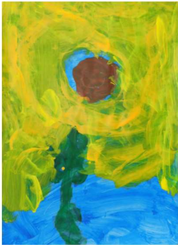
作品名 ひまわり 作者名 佐田かおり (さだかおり) サイズ 1091×788mm