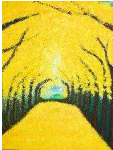
作品名 銀杏並木紅葉 作者名 齋藤晴久 (さいとうはるひさ) サイズ 1455×1120mm