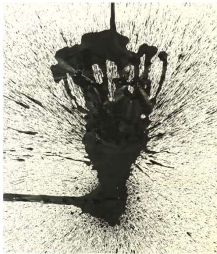
作品名 澤田墨 作者名 澤田隆司 (さわだたかし) サイズ 580×510mm