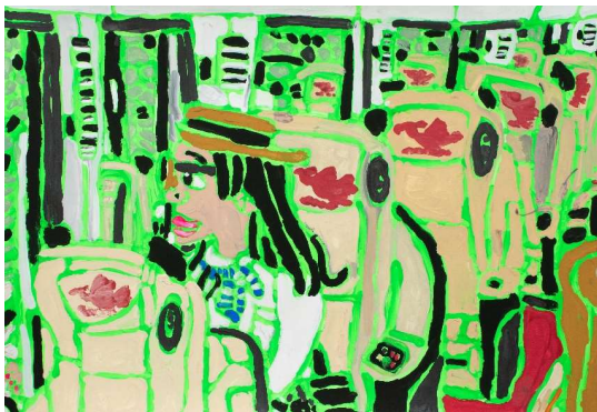
作品名 大阪-名古屋とつきゅう 至福な二時間の電車旅 作者名 小田浩之 (おだひろゆき) サイズ 545×788mm