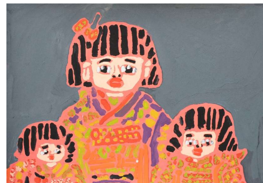
作品名 左：徳山42cmオリジナル着物 中：松見齋39cm 右：公龍齋勝光35cmオリジナル着物 作者名 小田浩之 (おだひろゆき) サイズ 545×788mm