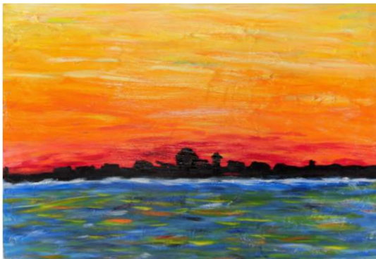
作品名 朝焼けの神戸 作者名 齋藤晴久 (さいとうはるひさ) サイズ 500×727mm