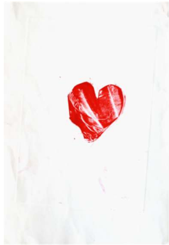
作品名 無題 作者名 佐田かおり (さだかおり) サイズ 1091×788mm