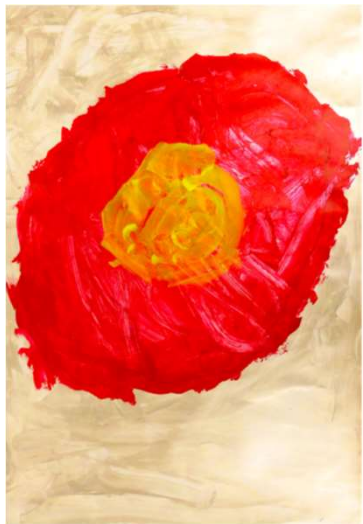
作品名 無題 作者名 佐田かおり (さだかおり) サイズ 1091×788mm