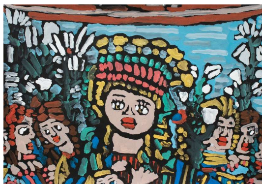
作品名 サンドロ・ボッティチェッリ 《百合の聖母》 作者名 小田浩之 (おだひろゆき) サイズ 545×788mm