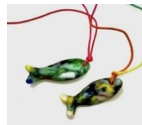
正倉院のガラスの装飾品をつくろう!(2/23)