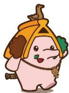
キャラクター：ほったん