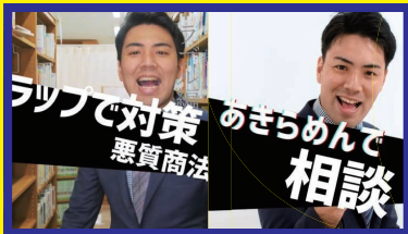
ラッパー教師“あきらめん”が 若者が遭いやすいトラブルをラップで伝えます!