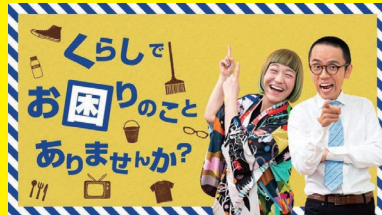
吉本芸人“女と男”が日常にひそむ トラブルをコントで演じます!