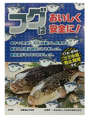
フグ中毒防止ポスター