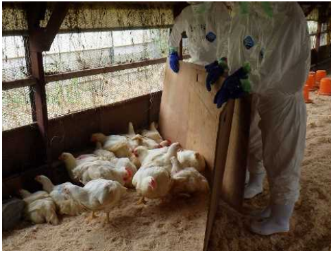
鳥インフルエンザモニタリング検査