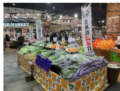
認証食品販売コーナー

安全・安心で個性・特長のある県産食品を県が現地調査や安全性検査、生産履歴記帳等により確認して認証する「ひょうご食品認証制度」を推進し、県民が安心して県産食品を購入できるよう認証食品の生産・流通・消費の拡大を図る。