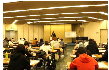
農薬管理指導士認定特別研修

農薬の取り扱いについて指導的役割を果たす農薬管理指導士を育成し、農薬による事故防止や農薬の安全かつ適正使用を進める。