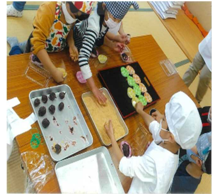
レシピの例 (おはぎ)