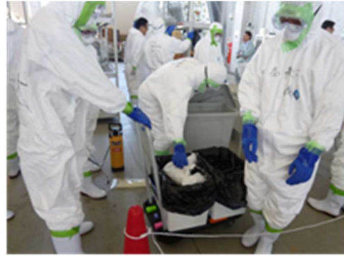
鳥インフルエンザ発生に備えた防疫訓練