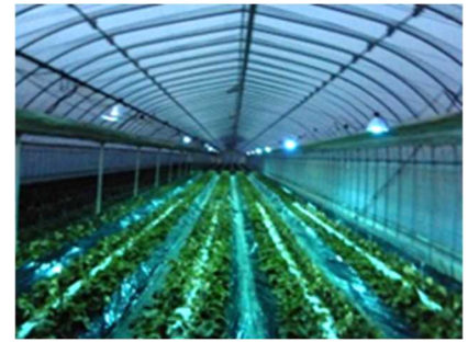
紫外線照射による病害虫防除

生産活動に由来する環境への負荷を低減するため、環境創造型農業を推進し、化学合成の肥料及び農薬の低減技術等（環境創造型農業技術）の普及拡大を図る。さらに、生産物に対する消費者の信頼度向上、生産者と流通・販売業者の連携強化や県民の理解促進に努める。