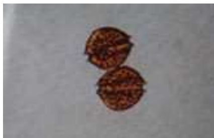
貝毒原因プランクトンの一種 (大きさ 1mmの 1/30)