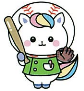
兵庫県 かんごちゃん

兵庫看護協会は災害時にいち早く活動をおこなっています。 ※当日は災害支援ナースの活動に従事した体験談が聞けます。