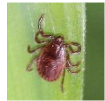
タカサゴキララマダニ