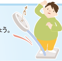
身長1.7m(170cm)の場合は、53.5～72.2kgが適正体重です。

・健診結果に合わせて、必要な精密検査や治療などをすみやかに受けましょう。食生活や運動などの改善が必要な場合は、専門家のアドバイスを受けましょう。