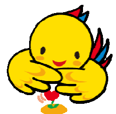
兵庫県マスコット はばタン