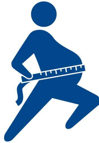
腹囲 ボリュームアップ