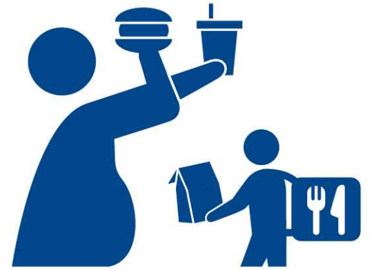
ハイカロリー デリバリー