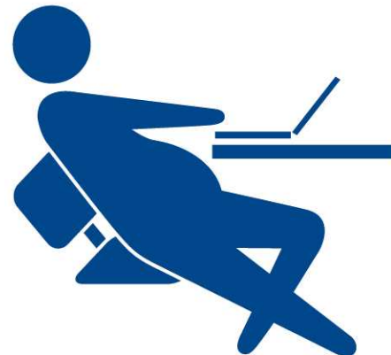
ノームーブ・ リモートワーク