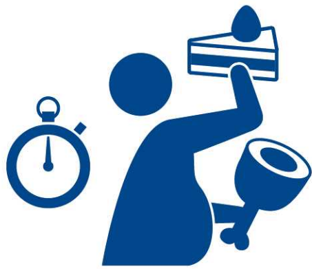
早食い タイムトライアル