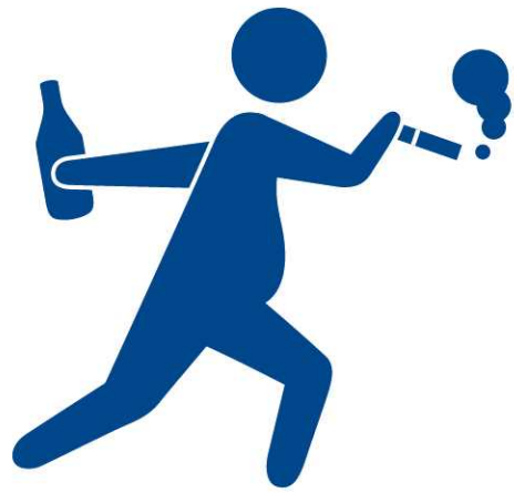
ドリンク&スモーク (ヘビー級)