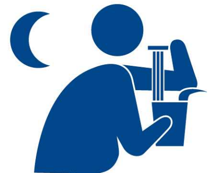
レイトタイム ラーメン