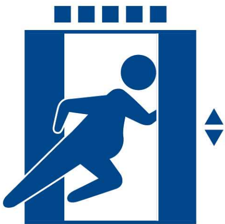
ノークライミング・ エレベーター