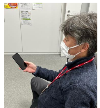
サポートプログラムを利用する職員

上記の他、パート職員を含めた定期健康診断・精密検査受診・ストレスチェックの実施など様々な取組を実施