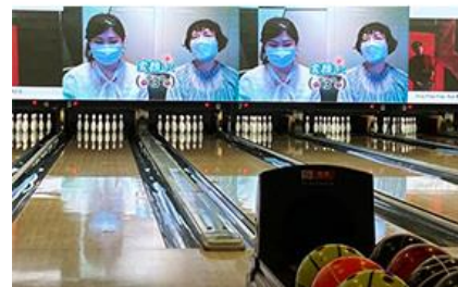
ボウリング大会の様子

上記のほか、二次健診(再検査)等の受診費用補助、対象者全員の受診必須化、スマホアプリを使用したウォーキングイベントの実施、残業時間削減、労働時間に対する生産性の高い事業所の社内表彰