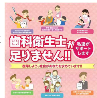
復職支援啓発ポスター