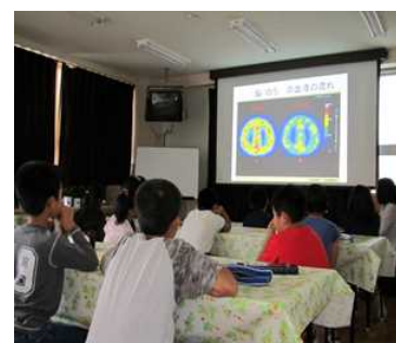
喫煙防止教室（小学校）

未成年者がたばこから自分の身を守ることができるよう、市町教育委員会と連携し、喫煙防止教室を開催するほか、教職員を対象に講習会を実施する。