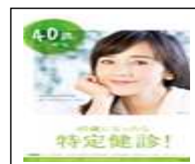
28 年度啓発ポスター