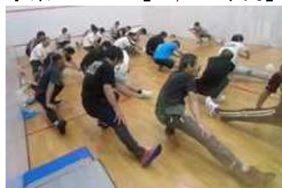
〈健康教室の実施風景〉