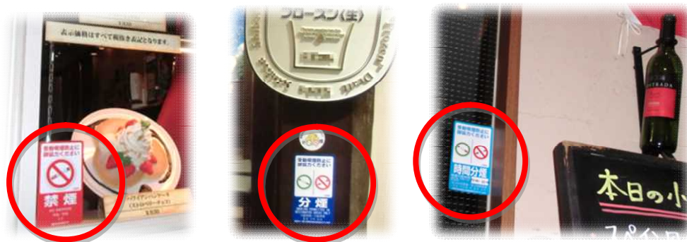
喫煙環境の店頭表示例