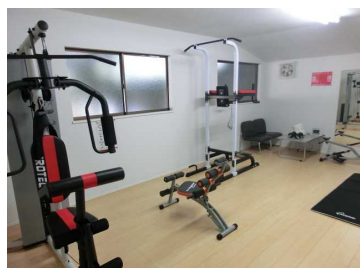
〈整備した運動施設〉