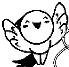
兵庫県マスコット ははたん

※その他、労働関係法令に関する重大な違反がないこと等、申請時にご確認いただく内容があります。