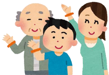
ステップアップ講座受講者