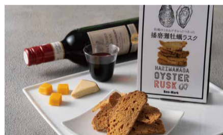
昨年度グランプリ受賞食品「播磨灘牡蠣ラスク」 製造者: Bon-Mark(相生市)