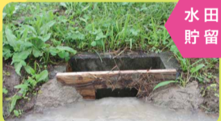
水田貯留 田んぼダム

西播磨県民局では、2013(平成25)年度から県内で初めての取り組みとして「田んぼダム」の普及啓発を推進しています。「田んぼダム」は、田んぼの排水口に切り欠きを入れた「せき板」により、台風などの大雨時に一時的に雨水を貯留し、流出を抑制する仕組みです。22(令和4)年度末までに約7,000枚のせき板を集落などに配布し、約1,900haの水田で取り組みが進んでいます。