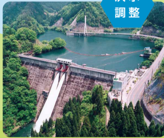
引原ダム(宍粟市波賀町)