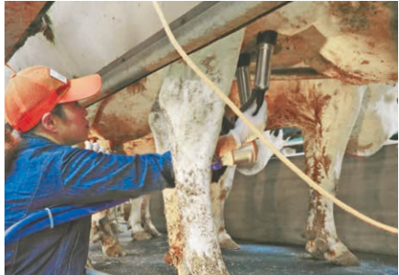
搾乳作業の様子。「乳房を見ただけでどの牛か分かります」

※淡路農林水産祭実行委員会が島内の牧場を対象に実施。定期的に生産乳の品質や量を検査し、年間の獲得点数に応じて表彰します