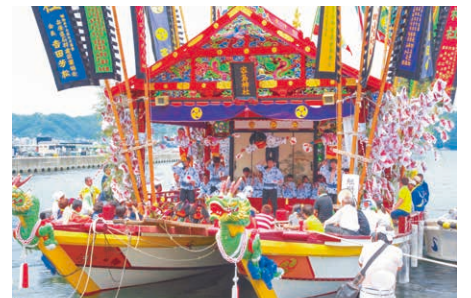
7月の家島天神祭で見られる宮だんじり船。