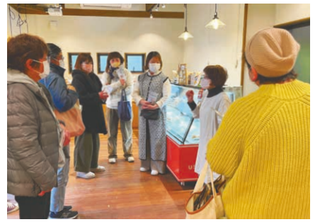
香川県の牧場直営店を見学した時の様子。

Q.地域ではどのような活動を。 市内の女性酪農家が集う「ミルククラブ」で長年要職を務めてきました。年数回、先進的な取り組みをしている牧場を見学したり、簿記を学んだりしています。先日は香川県にある牧場直営の乳製品の店を訪ね、6次産業化について学びました。