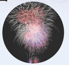
4年ぶりに前夜祭花火大会も開催されました。

相生ペーロン祭のペーロン競漕に、選手として参加。どらや太鼓の音が響く相生湾で、チーム一丸となって船をこぐのはとても爽快でした。100年を超える歴史を持つこの競技を次の100年につなげるために、地域の皆さんと一緒に盛り上げていきます。