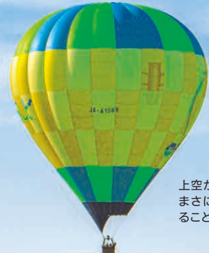
上空から眺める山並みはまさに絶景。雲海が現れることも。

●一般3,500円、65歳以上・中学生以下2,500円、3歳以下無料 ※7日前までに要予約 ●神鍋そらんど ●0796-45-1545