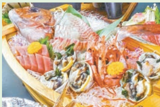
「国生み会席プラン」(舟盛り5人前)

県内5カ所にあるひょうご憩の宿では、それぞれ夏限定の特別プランを提供しています。津名ハイツ(淡路市)では、郷土料理の鯛宝楽焼きや旬の鮮魚の舟盛りなど淡路の旬の食材をふんだんに使った料理を味わえます。夏の味覚を満喫しませんか。