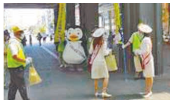
姫路駅前啓発活動。

犯罪や非行をした人を再び地域に受け入れ、支え、見守るため、「社会を明るくする運動」※などを通して県民の皆さんの理解促進に努めています。誰もがやり直せる環境をつくるには、地域に住む全員がそれぞれの立場で関わるのが重要です。7月は「社会を明るくする運動」の強調月間です。啓発イベントに参加する、保護司や協力雇用主などのボランティアに加わる等、更生支援について考えてみませんか。(県くらし安全課)