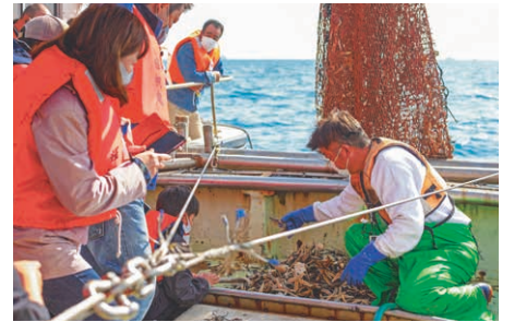
漁師が底引き網で取れた魚介類を説明してくれます。

ひょうごフィールドパビリオンとは 2025年大阪・関西万博に向けて地域の持続可能な未来を実現する活動の現場(フィールド)を展示館(パビリオン)に見立てて発信する取り組み。