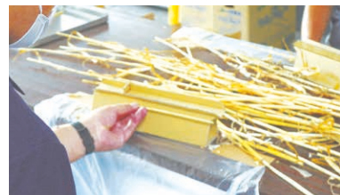
品質にこだわり、刈り取りは手作業。外皮むきやカットは障害福祉サービス事業所が担当しています。

六条大麦 ストロー2箱と 大麦商品 3種類を5人に プレゼント 応募方法は7面へ