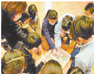
兵庫陶芸美術館 (丹波篠山市) 「さわってみよう丹波焼」 7月16日(日)