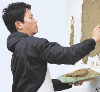
昔ながらの土壁で、壁塗りを体験。

淡路島の地域資源「土」とアートを融合させた淡路市の「土のミュージアム SHIDO」を視察し、飛鳥時代から続く土壁づくりを体験。壁や床が土で覆われた施設と芸術作品、そして地域活性化に取り組む若者の力を結集させた活動には、万博のほか瀬戸内国際芸術祭との連携など可能性の広がりを感じました。地域がまいた種が花開くよう、県も取り組みを推進します。