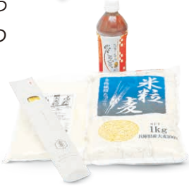
大麦商品(ふあ〜みん麦茶、米粒麦、大麦粉)

六条大麦 ストロー2箱と 大麦商品 3種類を5人に プレゼント 応募方法は7面へ