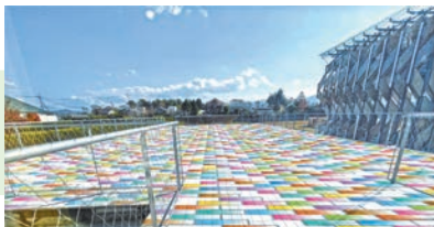
「mt project」イメージ(GREENable HIRUZEN)

カラフルなマスキングテープと観光地のコラボレーションが人気の「mt project」。この夏は蒜山高原や旧吹屋小学校、倉敷美観地区で楽しめます。また、「くだもの王国おかやま」の代表的なフルーツ、白桃やブドウを主としたグルメ企画もあります。「こころ晴ればれおかやまの旅」をお楽しみください。