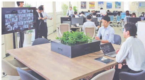
モデルオフィスでオンライン会議。

出勤率4割を目指すテレワークの実施など、全国に先駆けた取り組みに挑戦します。業務のパフォーマンスを高め、生み出された新たな価値を県民の皆さんに還元していきます。