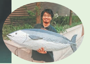
兵庫県明石市出身の三井さん。