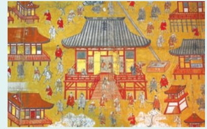
中山寺参詣 曼荼羅(部分) 桃山時代 中山寺所蔵

江戸時代、旅に出るのは人々の憧れでした。同展では、近世・近代に盛んに行われた県内の温泉地(有馬温泉・城崎温泉)や西国三十三所巡礼、金毘羅参りといった「聖地巡礼」の旅を古書や絵画で紹介します。