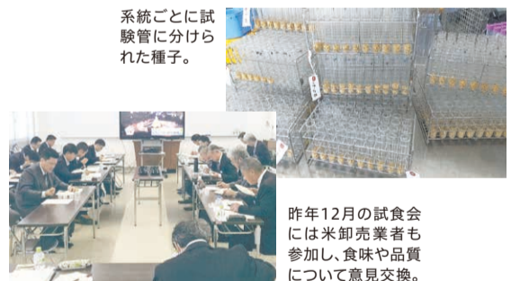
昨年12月の試食会には米卸売業者も参加し、食味や品質について意見交換。

県立農林水産技術総合センター 0790-47-2412 0790-27-8433 兵庫県立農林水産技術総合センター