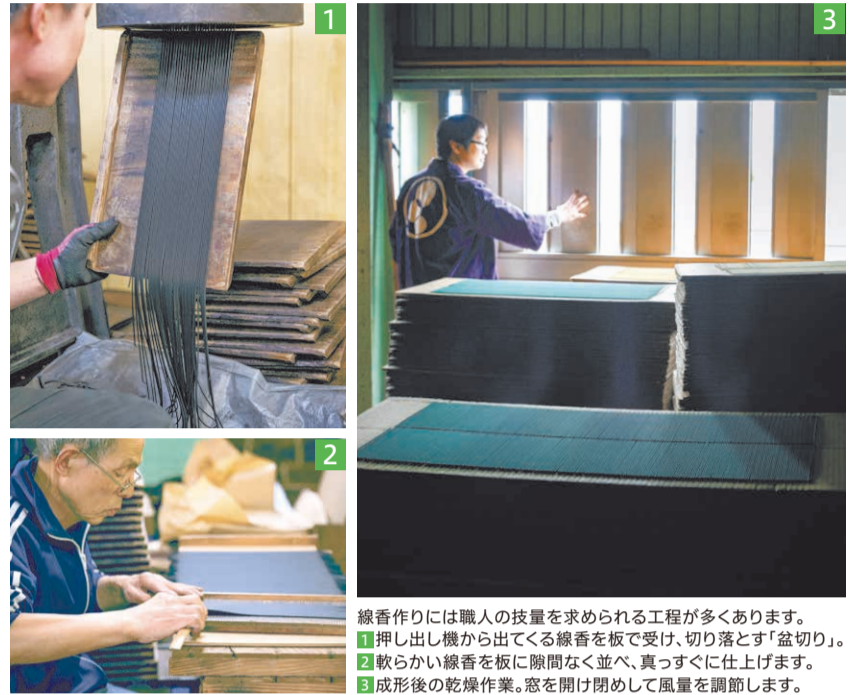
線香作りには職人の技量を求められる工程が多くあります。 1 押し出し機から出てくる線香を板で受け、切り落とす「盆切り」。 2 軟らかい線香を板に隙間なく並べ、真っすぐに仕上げます。 3 成形後の乾燥作業。窓を開け閉めして風量を調節します。

※プログラムの詳細や予約方法等は専用サイト「あわじフレグランス」で確認してください。また、同組合に体験したい内容(工場見学やガイドツアー等)や滞在時間、人数を伝えれば、オリジナルのプログラムを組んでもらえます