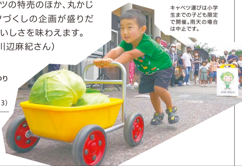
キャベツ運びは小学生までの子ども限定で開催。雨天の場合は中止です。