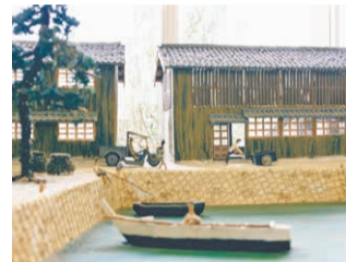
旧江井小学校の校舎を活用した複合施設「eito(エイト)」では、昭和30年代の江井地区を再現したジオラマを展示しています。