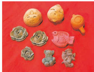
お香作り体験は家族で気軽に楽しめます。

パルシェ香りの館で人気の香水作り体験。24種類の天然精油から好きなものを選んで調合します。