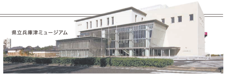
県立兵庫津ミュージアム

この機会に五国について学び、兵庫の魅力を再発見してください。昇級を目指し学び続け、故郷をもっと好きになってほしいです。