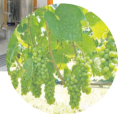
昨年実ったブドウ。現在はシャルドネをはじめ9品種を栽培しています。