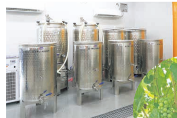
真新しい醸造所には300ℓを貯蔵できるタンクがずらりと並びます。