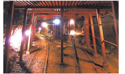
日本一のスズ採掘量を誇った明延鉱山。坑内の設備や車両は当時のまま残っています。

1987(昭和62)年の明延鉱山の閉山後も、養父市の明延地区は鉱山の遺構を守ってきました。近年は地区全体を博物館に見立てた取り組みを展開し、往時の面影を求めて訪れる人が増えつつあります。観光のメインである坑道の見学では、ボランティアガイドの案内で、鉱石の搬出に使われたトロッキやエレベーターなどの遺構を見ることができます。鉱山と神子畑選鉱場を結んでいた一元電車の体験乗車、昭和初期の共同浴場や鉱員の社宅が残る明延地区の散策もお勧めです。(養父市経営政策・国家戦略特区課 圓山裕基さん)