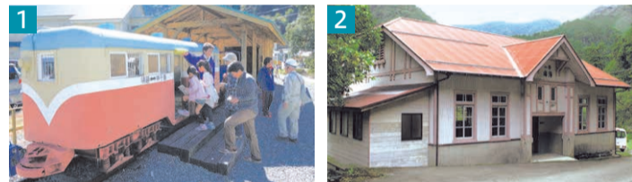
1 一元電車の体験乗車会の様子。乗客数が分かりやすいよう運賃1円で運んでいたのが愛称の由来です。 2 1934年建築の「第一浴場」はミュージアムとして活用されています。