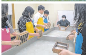
体験の様子(【上】尼崎運河クルーズ【下】杉原紙手すき体験)。