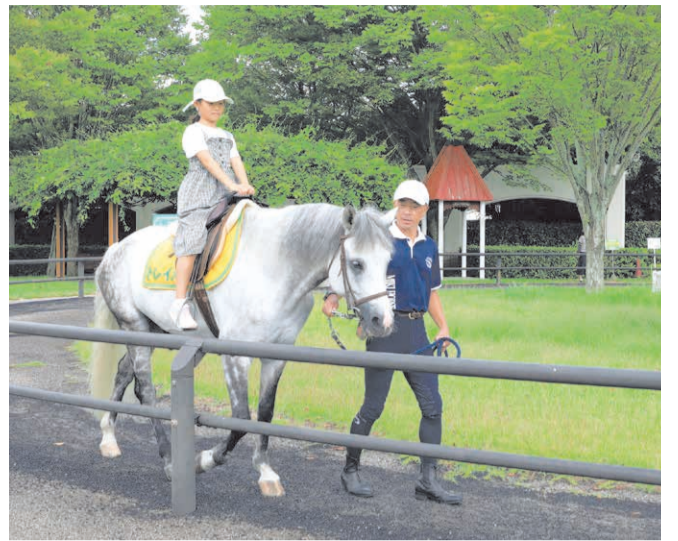
ポニーに乗ってリンクを1周する引き馬体験は大人600円、子ども400円。水曜、金曜、土曜、日曜、祝休日に実施しています。