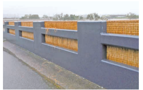
西日本豪雨の際の畳堤。畳は横191cm、縦95cmの本間サイズで、現在は全て自治会等の倉庫で管理されています。

たつの市を流れる揖保川には、川沿いに連なるコンクリートの枠に畳を差し込むことで増水時に堤防として機能させる畳堤があります。住民の自主防災意識から誕生した、全国でも3河川にしかない特殊な堤防です。(取材・文 本紙編集部)