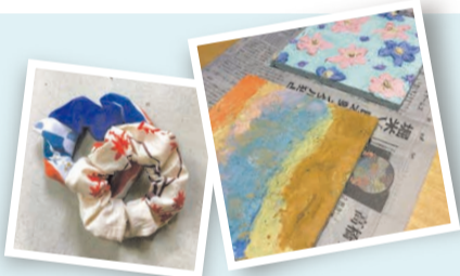
【左】手拭いの端切れで作ったシュシュ【右】土の風合いを楽しめる土壁アート。

①S BRICK ②洲本市塩屋1-1-8 ☎0799-24-0550(フードベースは☎0799-25-1500) ☎0799-24-0551 ESブリック