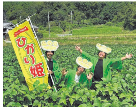
ひかり姫を生産する加西市の農業団体「農のクリエイティブ万願寺」の皆さん。PRにも一役買っています。