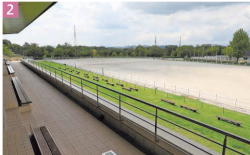
1月曜、火曜を除き1日2回、26頭が暮らす厩舎を無料で見学できます。中には元競走馬も。2観覧席から屋外競技馬場を一望。