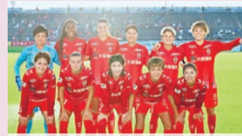
INAC神戸レオネッサ: ©INAC KOBÉ LEONESSA

申 神戸ストークスは当日試合開始まで、INAC神戸レオネッサは前日までに☎で各クラブへ 問 県スポーツ振興課 ☎078-362-9438 ☎078-362-4022