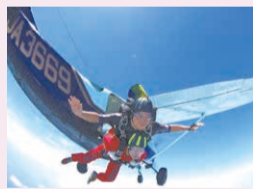
スカイダイビングのタンデム体験も(要申し込み)。

④県空港政策課 ☎078-362-3561 ☎078-362-3923 但馬空港