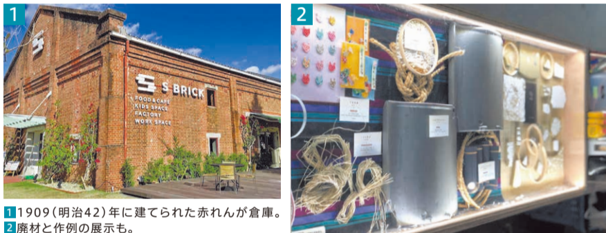
1 1909(明治42)年に建てられた赤れんが倉庫。 2 廃材と作例の展示も。