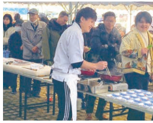
刺し身の無料試食には毎年多くの人が並びます。