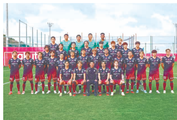
一致団結してアジアナンバーワンクラブを目指します。