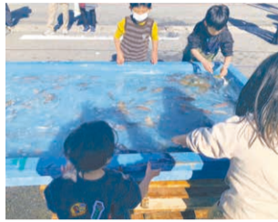
生きた魚に触れられる貴重な機会です。