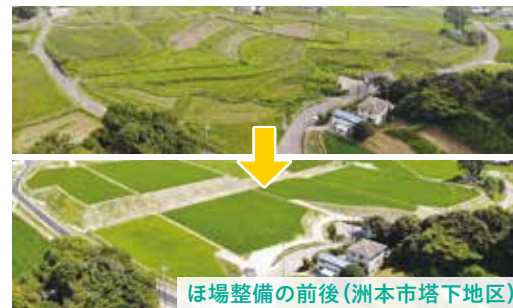
ほ場整備の前後(洲本市塔下地区)

☎洲本農林水産振興事務所農政振興第2課 ☎0799-26-2099 ☎0799-22-1443