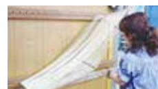
そうめんの製造体験