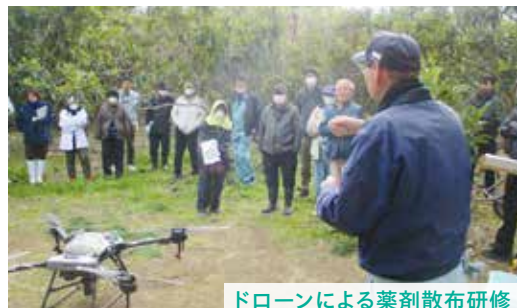
ドローンによる薬剤散布研修