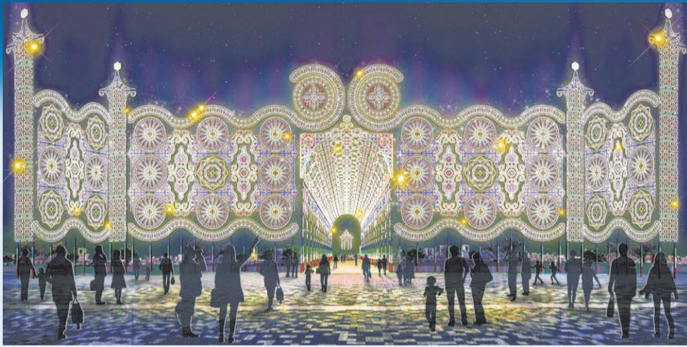
「フロントーネ」「ギャラリー」イメージ図