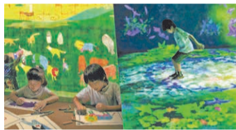
チームラボ《お絵かきアニマルズ&天才ケンケンパ》 ©チームラボ

自分で描いた動物たちがデジタルアートで彩られた花と緑の空間で動き出し、「自然と生きる」没入感を体験できます。