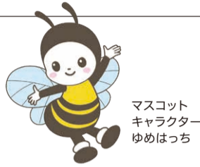
マスコットキャラクター ゆめはっち

「淡路花博25周年記念 花みどりフェア」が3月20日(土)に開幕します。淡路市、洲本市、南あわじ市のメイン会場や88の観光施設など淡路島全体で、4月27日(日)まで各種イベントが催されます。25年前、国際園芸・造園博「ジャパンフローラ2000」を契機に5年に1度開かれてきた花みどりフェアも、今回が最後。大規模な美しい花壇をはじめ豊かな自然を堪能したり、SDGsや自然の脅威への対応を学んだり、いろいろな角度から「人と自然の共生」の理念や淡路島の魅力を体感できます。(淡路花博25周年記念事業実行委員会)