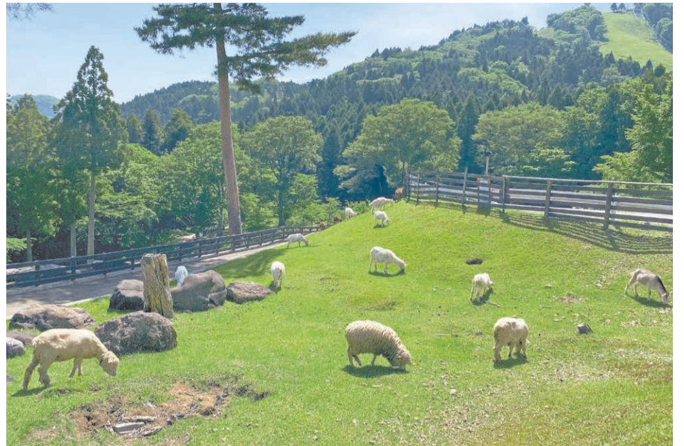
放牧時間は9時～16時。天気の良い日限定です。

④県立但馬牧場公園 ⑤新温泉町丹土1033 ☎0796-92-2641 ⑥0796-92-2640