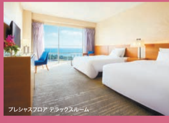
プレシャスフロア デラックスルーム