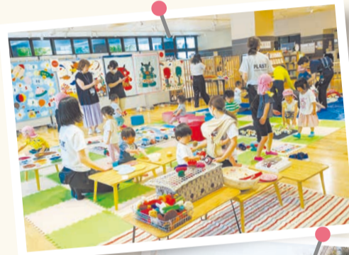
地域交流やイベントなど、さまざまな活動を支援する施設を整備。