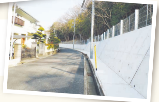
崖崩れから人命を守るため、擁壁工事等の急傾斜地対策を実施(写真は垂水区)。