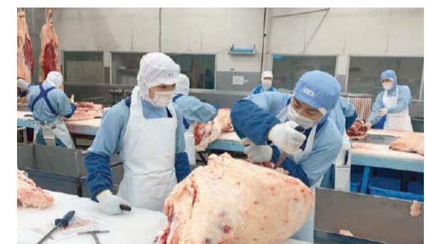
マイスターは、後進の技術指導者としても活躍。

Q. 今後の展望は。 マイスターは肉のあらゆることに応えられる、プロ中のプロ。自信を持ってお客さんにおいしいお肉を提供できます。現在、マイスターに認定されている技術者は工場などで活躍している人が多いのですが、専門店や卸売業などにも参加を呼び掛け、「マイスターがいる店」といった付加価値としても活用してもらいたいと考えています。