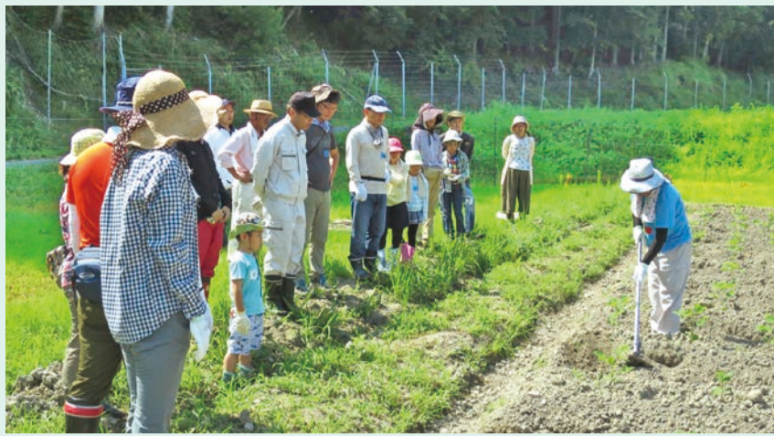
イソシヤシカなどの隠れ場となっていた耕作放棄地を整備し、農業体験の場として提供（写真は平成30年）。