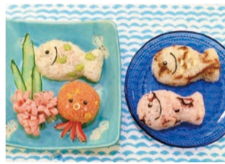
昨年度最優秀賞「つりにつれてって」