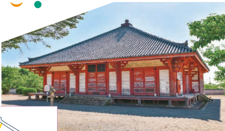
浄土堂外光の 反射経路

「大仏様という建築方式を用いた仏堂で国内に残るのはここだけです。阿弥陀三尊立像と共に国宝に指定されています」と鑑さん。