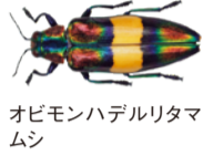
オビモンハデルリタマムシ