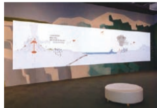
自然現象と人々の生活との関わりを映像で解説。

まず映像コーナーで「地震や台風、火山の噴火などの自然現象と人々の暮らしが交わることで自然災害につながる」ということを理解してから、展示物を通して自然災害が発生するメカニズムを正しく知り、適切な避難のタイミングや方法を学ぶ流れとなっています。