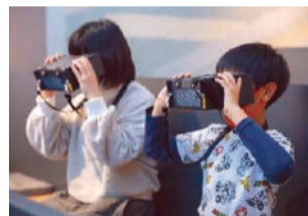
VR映像は専用ゴーグルで観賞。

地震、津波、風水害の災害現場を疑似体験できます。津波の映像では、避難タワーの屋上へ向かいたいののに人が殺到してなかなか上へ行けないというシーンを盛り込み、実際に直面するであろう避難の難しさを表現しました。