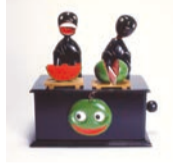
神戸人形 西瓜喰い(県立歴史博物館蔵)

1月8日④～2月6日⑨9時～17時※月曜(祝休日の場合は翌日)休館 県立歴史博物館の所蔵品を出張展示。民俗資料や焼き物などの資料を通して五国の歴史と文化を紹介します。 ⑩尼崎市立歴史博物館(尼崎市) ⑪県立歴史博物館 ☎079(288)9011 ☎079(288)9013 兵庫県立歴史博物館