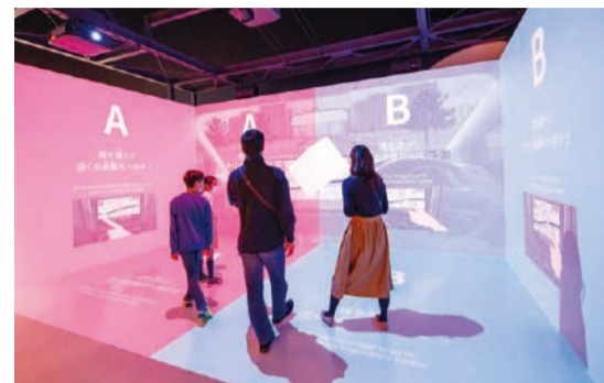
避難時の判断力を問う二択クイズ。

人と防災未来センター 神戸市中央区脇浜海岸通1-5-2 ☎078(262)5050 ☎078(262)5055 9時30分～17時30分 (金曜、土曜は19時まで) 月曜(祝休日の場合は翌平日) 一般600円、大学生450円、 70歳以上300円、高校生以下無料 ひとぼう 🔍