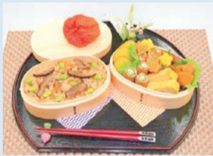
山椒で健康UP! いろいろ弁当