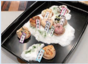
ぐるっと一周! 美しい物あるよ兵庫県