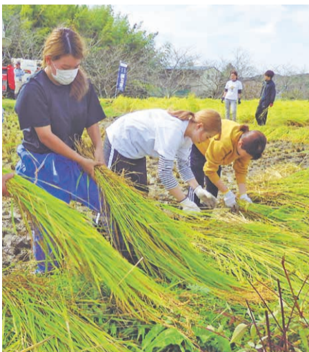
田植えや収穫体験、農家との触れ合いができるプログラムも予定されています。

酒造好適米として全国に名をとどろかす「山田錦」は、大粒で心白が中央にあり、タンパク質含量が少ないのが特徴。香り、味わいともに優れた日本酒に仕上がるため、飲み手にも酒造家にも人気の品種で、“酒米の王様”と呼ばれています。始まりは1923(大正12)年、県立農事試験場(現県立農林水産技術総合センター)で「山田穂」と「短稈渡船」を交配。産地適応性の試験等