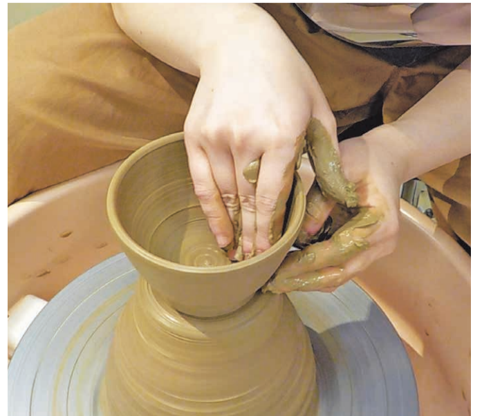
陶芸体験ができるスポットも。

平安時代末期の開窯とされ、800年以上にわたって受け継がれてきた「丹波焼」。瀬戸や常滑、信楽などと共に「日本六古窯」の一つに数えられ、産地である丹波篠山市今田地域には約60の窯元が連なります。伝統的な丹波焼は、登り窯で焼成する素朴で野趣あふれる生活用器が魅力。現在はモダンな作品も増え、色や形、手触りなど、窯元ごとに異なる作風が楽しめます。周辺には陶芸体験ができる丹波伝統工芸公園「立杭 陶の郷」や陶磁器をテーマとした兵庫陶芸美術館もあり、陶芸の魅力に浸れます。