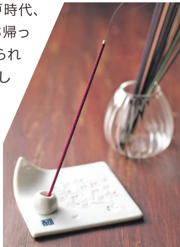
アロマ感覚で楽しむ人も増えている淡路島の線香。

淡路島は生産量日本一を誇る線香の一大産地です。江戸時代、江井地区(現淡路市)の商人が堺から職人と技術を持ち帰ったのが始まり。以来170年余り、線香作りが脈々と続けられてきました。線香メーカーには香司と呼ばれる人が存在します。調香から仕上げまで全工程において品質を管理。一切の妥協を許さない、香りをつかさどるマイスターです。近年は、兵庫県線香協同組合に所属するメーカーの香司がそれぞれの感性でプロデュースした香りをパッケージ化したシリーズを販売しています。江井地区に集うメーカーの中には線香作り体験ができる所も。豊かで繊細な香り漂うまちは、環境省の「かおり風景100選」にも認定されています。