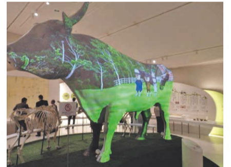
2018(平成30)年にリニューアルした但馬牛博物館。館内には昔の農家住宅を再現した「農業遺産体験館」も。

甘みのある赤身と細かく入ったサシ(脂肪)が極上の味を織り成す最高級ブランド和牛「神戸ビーフ」。霜降りの度合いや肉のきめ細かさなど、厳しい認定基準を満たすものだけに与えられる称号です。素牛となる「但馬牛」は、県外の牛と一切交配せず、繁殖から肉牛としての出荷まで全てを兵庫県内だけで行っています。新温泉町にある「県立但馬牧場公園」では放牧された但馬牛が見られるほか、併設する「但馬牛博物館」で但馬牛の歴史や神戸ビーフのおいしさの理由を学べます。