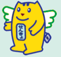
明るい選挙キャラクター「選挙のめいすいくん」