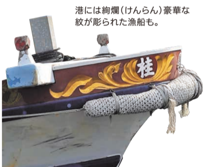
港には絢爛(けんらん)豪華な紋が彫られた漁船も。

姫路港から定期船で約30分、美しい海に囲まれた坊勢島は、瀬戸内海国立公園に含まれる大小44の島々から成る家島諸島の一つ。周囲約11kmと小さく、山が海岸まで迫り平地が少ない地形のため、急斜面に家々が立ち並ぶ独特の景観が広がっています。大半の家庭が漁業に従事しており、活気に満ちた港には漁船がずらり。その総数は800隻ともいわれ、県内で1、2を争う漁獲高を誇っています。釣り人も多く訪れるほか、全国でも珍しい漁業見学船「第八ふじなみ」に乗っての漁業見学やブランド魚「ぼうぜ鯖」の餌やり、海鮮バーベキューなど、島ならではの非日常体験が観光客を魅了しています。