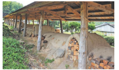
県の重要有形民俗文化財に指定されている「最古の登窯」。

平安時代末期の開窯とされ、800年以上にわたって受け継がれてきた「丹波焼」。瀬戸や常滑、信楽などと共に「日本六古窯」の一つに数えられ、産地である丹波篠山市今田地域には約60の窯元が連なります。伝統的な丹波焼は、登り窯で焼成する素朴で野趣あふれる生活用器が魅力。現在はモダンな作品も増え、色や形、手触りなど、窯元ごとに異なる作風が楽しめます。周辺には陶芸体験ができる丹波伝統工芸公園「立杭 陶の郷」や陶磁器をテーマとした兵庫陶芸美術館もあり、陶芸の魅力に浸れます。