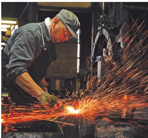
市内には昔ながらの工房も残り、つち音を響かせています。

三木市が全国屈指の金物のまちとなったきっかけは、1578(天正6)年の羽柴秀吉による三木城攻めでした。焼け野原になった城下の復旧のために大工職人が各地から集まったことで、大工道具の製造が発展。長い時をかけて培われた技術は上質の金物を生み、のこぎり、のみ、かんな、こて、小刀は国の伝統的工芸品にも指定されています。道の駅「みき」には、市内の製造・卸業70数社の約2万アイテムがそろった「金物展示即売館」もあります。