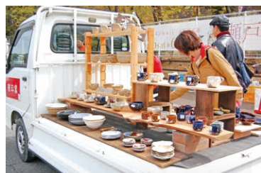
一昨年から始まった軽トラ市。