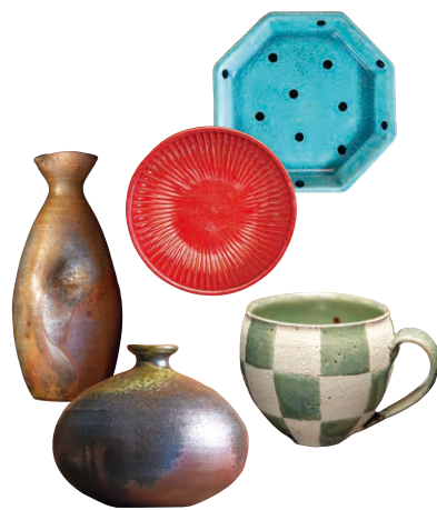
登り窯で焼いた重厚感のある器から釉薬を使った色彩豊かな器まで、バラエティーに富んでいるのも丹波焼の魅力です。

第45回丹波焼陶器まつり 秋の郷めぐり ☎10月6日(土)~23日(日) ☎丹波篠山市今田町立杭地区 ☎丹波伝統工芸公園「立杭 陶の郷」 ☎079-597-2034 ☎079-597-3232 陶の郷