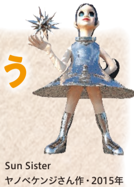
Sun Sister ヤノヘケンジさん作・2015年

美術館やギャラリーではなく、広場や道路、公園など公共の空間に設置されたパブリックアート。県立美術館と神戸市立王子動物園を結ぶ「ミュージアムロード」周辺では、見上げるほど大きな像や色鮮やかなオブジェなど、多種多様なアートに出会えます。