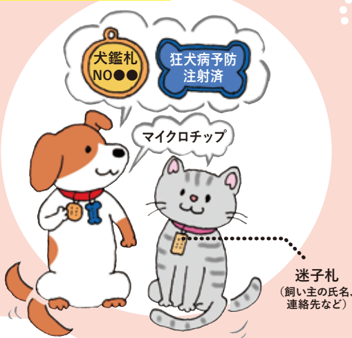
迷子札 (飼い主の氏名、連絡先など)

突然の災害はもちろん、普段の生活でも思いがけないアクシデントで飼い主と離れ離れになるかもしれません。ペットが迷子になりどこかで保護されたとき、すぐに飼い主と分かるように日頃から首輪、迷子札、犬の鑑札と狂犬病予防注射済票、マイクロチップなどを装着しましょう。