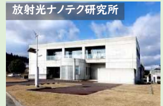
放射光ナノテク研究所