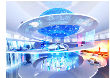
2025年日本国際博覧会 大阪パビリオン内のイメージ