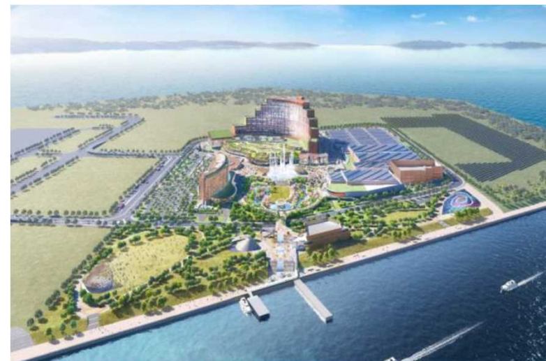
イメージパース: 全景