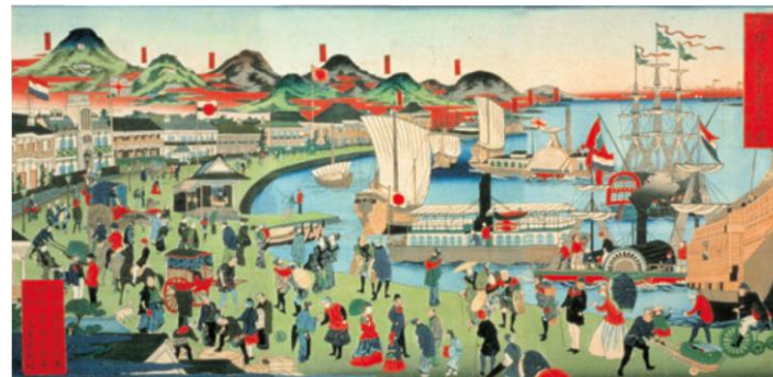
摂州神戸 海岸繁栄之図