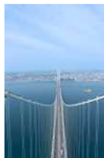
【明石海峡大橋の主塔・塔頂体験】