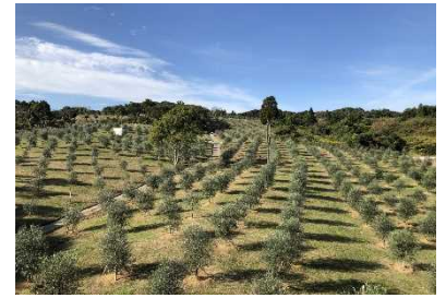
【北淡路に広がるオリーブ園】