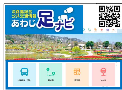
【あわじ足ナビポータルサイト】 http://www.awaji-ashinavi.jp