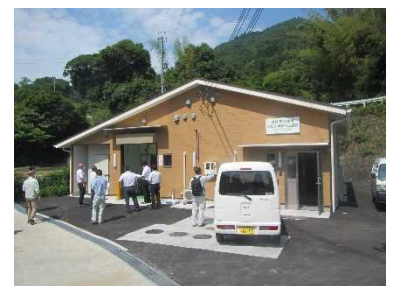
【ジビエ処理加工施設(淡路市興隆寺)】