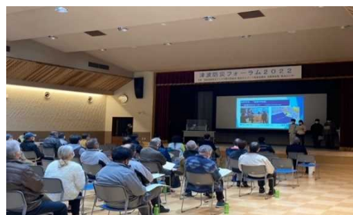
【津波防災フォーラム 2022 の様子】