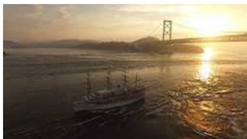
【鳴門海峡の渦潮・サンセットクルーズ】