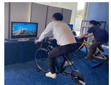
【バーチャルサイクリング体験会】