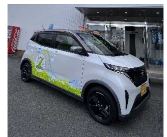
【あわじ環境未来島構想のラッピングを施したEV】