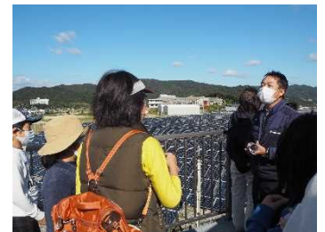
【南あわじメガソーラー見学】