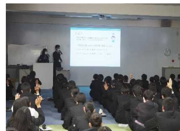
【高校での出前講座】