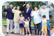
子育てするなら ダントツ多可町