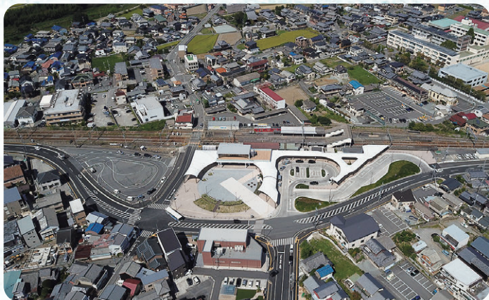
福崎駅前のまちなみ