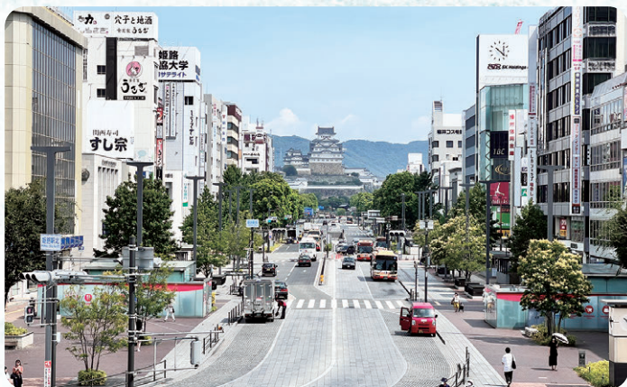
姫路駅北・キャッスルビューからの眺め