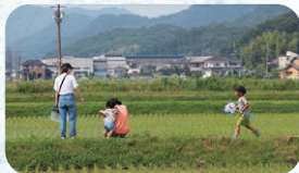
市内郊外部イメージ