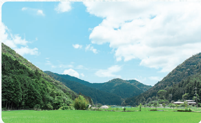
有機農業が盛んなまち