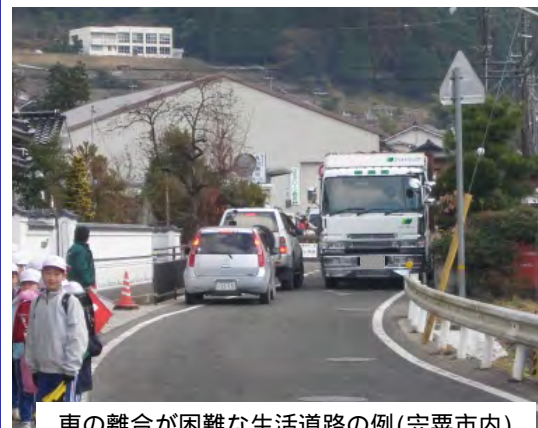
車の離合が困難な生活道路の例(宍粟市内)