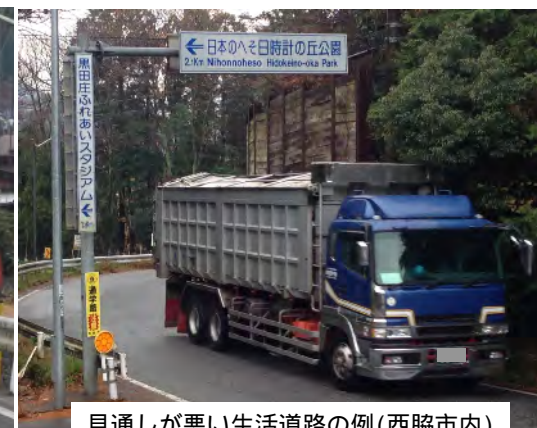
見通しが悪い生活道路の例(西脇市内)