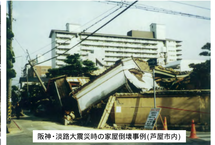
阪神・淡路大震災時の家屋倒壊事例(芦屋市内)