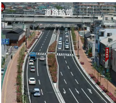
都加古川別府港線(加古川市)