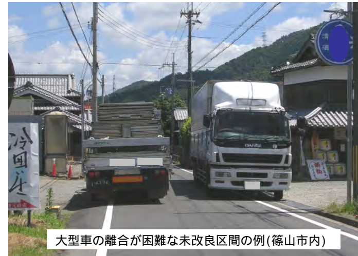
大型車の離合が困難な未改良区間の例(篠山市内)