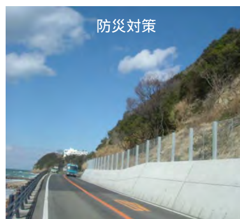
福良江井岩屋線(淡路市)