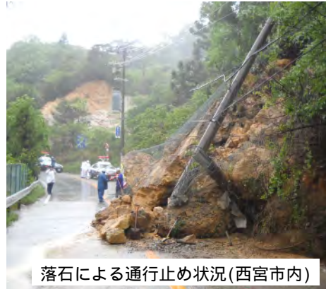
落石による通行止め状況(西宮市内)