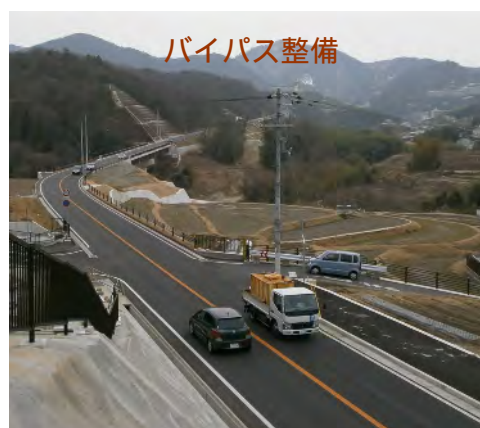
有馬山口線(西宮市)