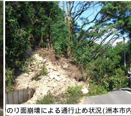
のり面崩壊による通行止め状況(洲本市内)