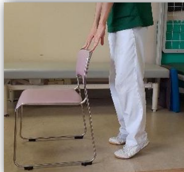
立ったまま踵上げ