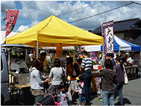
【丹波甲賀の里 軽トラ市】