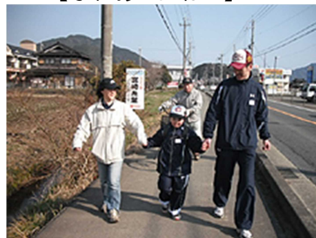
【ウォーキング大会】