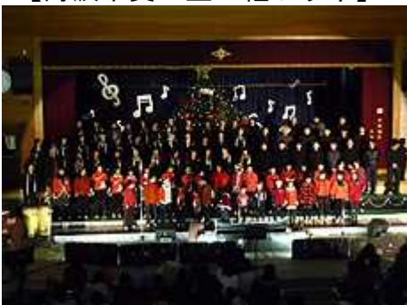
【こうが山ゴスペルコンサート】