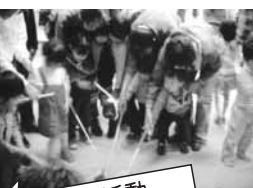
環境教育活動 (加古川市西神吉地区)