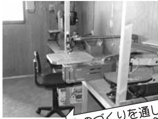
ものづくりを通して交流 するための木工創作室 (相生市相生地区)