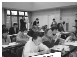
地域の歴史講座 (神戸市北区有馬地区)