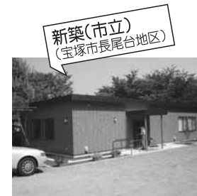
新築(市立) (宝塚市長尾台地区)