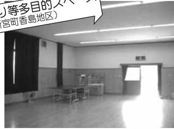
健康づくり等多目的スペース (たつの市新宮町香島地区)