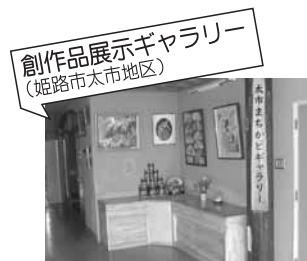
創作品展示ギャラリー (姫路市太市地区)