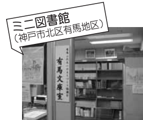
ミニ図書館 (神戸市北区有馬地区)