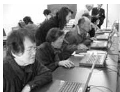
世代交流/パソコン教室 (㊤篠山市西紀北地区 ㊦神戸市北区大原・桂木地区)