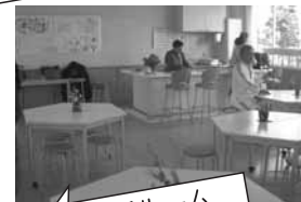
ランチルーム (稲美町天満南地区)