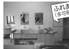
ふれあいキッチン (多可町大和地区)