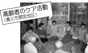
高齢者のケア活動 (養父市関宮地区)