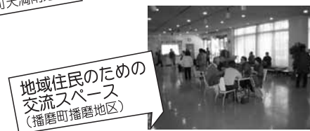
地域住民のための交流スペース (播磨町播磨地区)