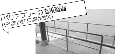
バリアフリーの施設整備 (丹波市春日町黒井地区)