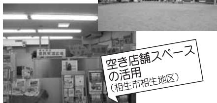
空き店舗スペースの活用 (相生市相生地区)