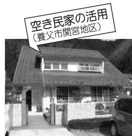
空き民家の活用 (養父市関宮地区)