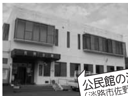
公民館の活用 (淡路市佐野地区)