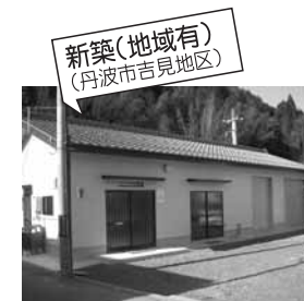
新築(地域有) (丹波市吉見地区)