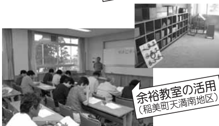
余裕教室の活用 (稲美町天満南地区)