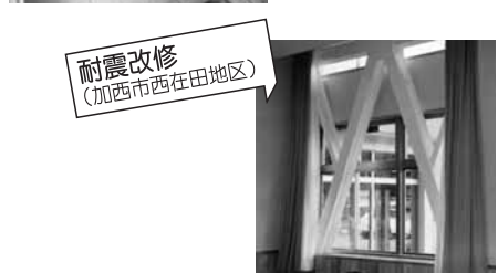
耐震改修 (加西市西在田地区)