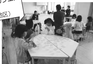
コミュニティカフェにおける交流 (稲美町天満南地区)