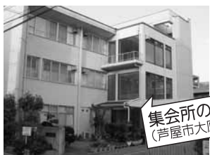
集会所の活用 (芦屋市大原地区)