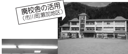
廃校舎の活用 (市川町瀬加地区)