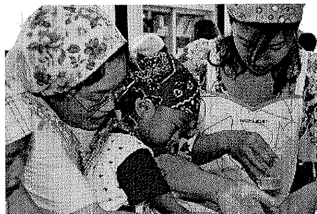
家庭と地域の再構築