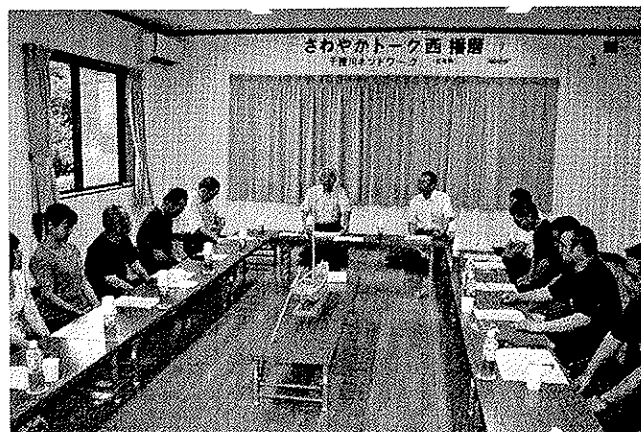
参画と協働の推進