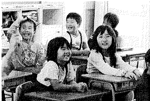
ひょうごの元気の創出