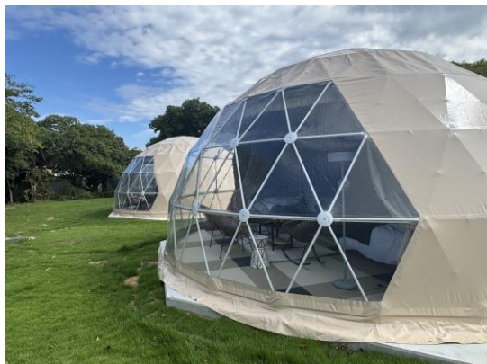
【ドームテント（外観）】