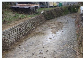
上比延谷川の土砂撤去 (西脇市)