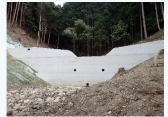
治山ダムの整備(兵庫県)