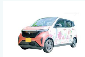
電気自動車の導入 (加東市)