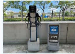
充電設備の整備 (太子町)