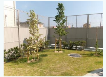
公園の緑化(姫路市)