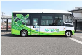
電気バスの導入 (南あわじ市)