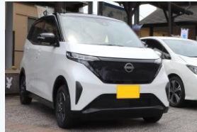
電気自動車の導入 (神河町)