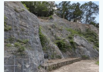
但東町正法寺地区の治山事業 (豊岡市)