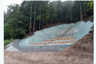
海上地区の治山事業 (新温泉町)