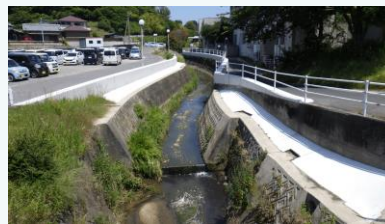
畑川の護岸改修 (淡路市)