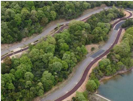
サイクリングコース