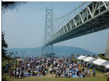
舞子公園と明石海峡大橋