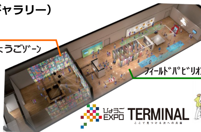
フィールドパビリオンゾーン