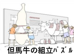
但馬牛の組立パズル