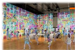
ミライのひょうごゾーン